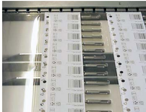
Aussen: Siegelstation für die PE-beschichteten Papieretiketten.