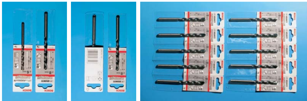
Links: Unterschiedliche Bohrer, einheitliche Verpackungsgrösse. Beim Tiefziehen passt sich die Verpackung automatisch den unterschiedlichen Bohrergrössen an. Mitte: Blick auf Vorder- und Rückseite des Tight Packs. Rechts: Fünflinge. Die Tight Packs werden in Fünfergruppen beim Handel abgeliefert und erst am POP vom Verkaufspersonal vereinzelt.

Verpackungssystem Tight Pack nutzt Packgut als Tiefziehwerkzeug